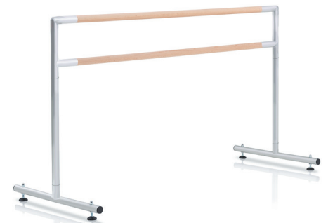
$295 Barra de 6' (183 cm) • Longitud: 72" (183 cm) • Peso: 15 lb (6,8 kg)