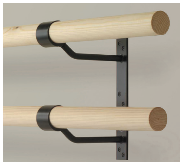
Barras dobles montadas en la pared $76