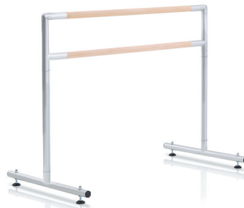
$259 Barra de 4' (122 cm) • Longitud: 52" (132 cm) • Peso: 12 lb (5,4 kg)