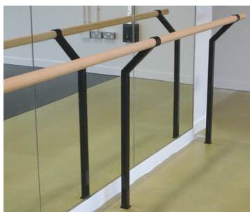
Barra simple montada en el piso $174