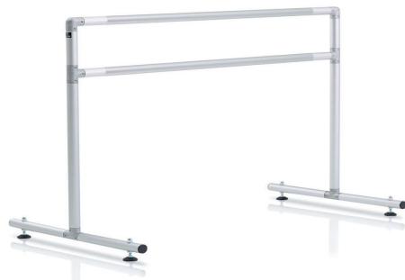
$570 Barra de 72" (183 cm) • Peso: 28 lb (12,7 kg)