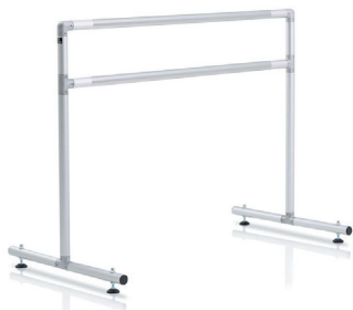
$470 Barra de 52" (132 cm) • Peso: 20 lb (9 kg)