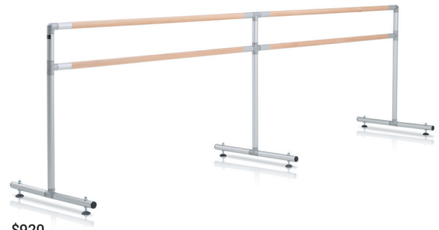
$920 Barra de 144" (366 cm) • Peso: 35 lb (15,9 kg) • Barra de aluminio sólo por pedido especial