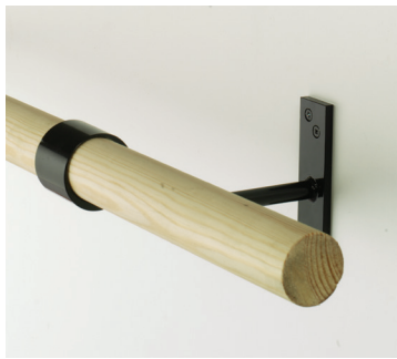
Barra simple montada en la pared $45